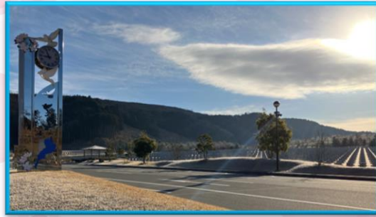
真冬の陽光に包まれるびわこ墓園

2月の異名は、如月(衣更着、さらに衣を重ねるといふ説)・仲春・梅見月などがあり、厳しい寒さの中にも小さな春を連想させる言葉があります。まだまだ寒い日が続きますが、びわこ墓園の植物たちは、少しずつ春の準備を始めているかもしれませんね。