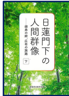
日蓮門下の人間群像(下) 創価学会教学部編 1500円