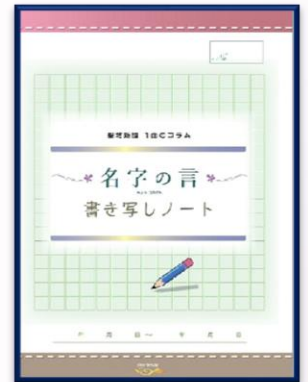
名字の言 書き写しノート 300円