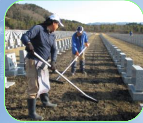
今年も目土入(芝生の生育をよくする)作業が始まりました。