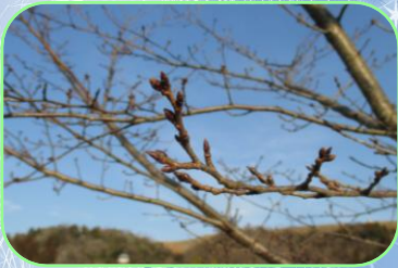
少しずつ、桜のつぼみが膨らみ始めています。

冬至と春分のちょうど半分にあたる日が立春(今年は2月4日)です。一年で最も寒い時期ですが、冬至の頃と比べると、ぐっと日が長くなりました。周りの春らしさを探してみると、身近な所で見つけられるかもしれませんね。