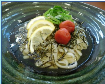
すっぱりうどん 770円(税込)