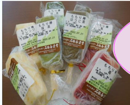
もちり棒（抹茶・ほうじ茶） 194円(税込) （いちご・みかん） 216円(税込)