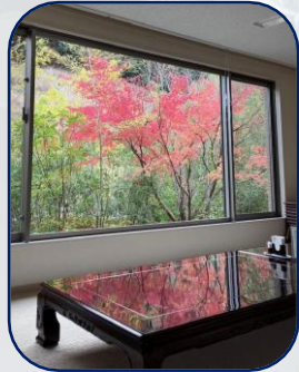
レストランからの紅葉