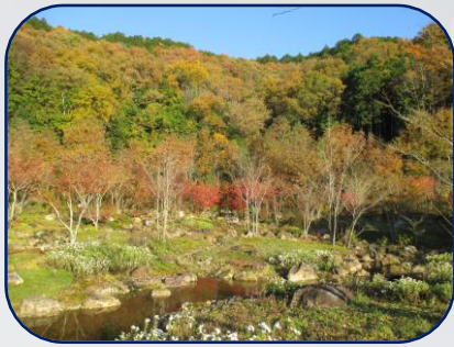
近江庭園初冬の風景

本年も多くの皆さまに見守っていただき、無事故で12月を迎えることができました。師匠の思いが詰まったびわこ池田記念墓地公園は、これからもご来園される皆さまを、温かくお迎えして参ります。